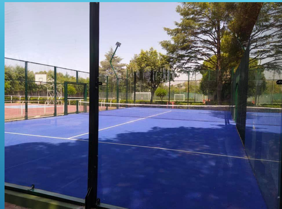
CAMPO DA PADEL «MANTINERA» PRAIA A MARE»